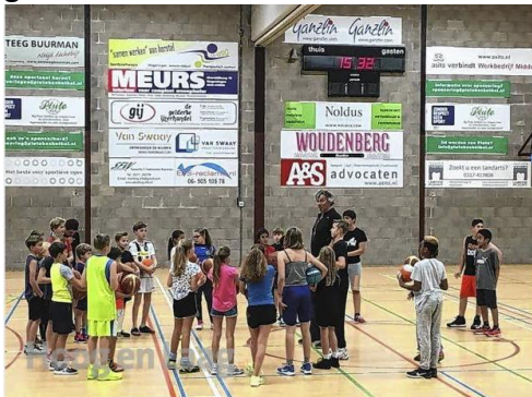
Hoog en Laag 29-10-2017

Bij het Pluto-Basketbal Toernooi wist de Tarthorst ook een mooie vierde plaats te bemachtigen! Dat dankzij mooi en sportief samenspelen. Ze hebben zelfs in de krant gestaan, tijdens het oefenen voor het grote toernooi: